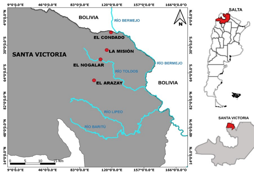
Figura 1. Ubicación geográfica Departamento Santa Victoria. Provincia de Salta.

Lipeo (Figura 1); además de Los Toldos, pertenecen al mismo departamento las localidades de: El Condado, Huaico Grande, Lipeo, Espinillo, La Misión, El Abra y El Arazay.